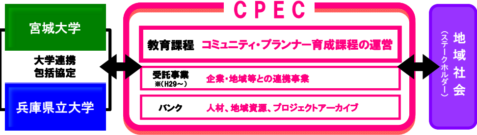
連携大学、ステークホルダーが一体となったプログラム実施体制

期待される成果 →地域ステークホルダーと協働した教育コースの評価体制組織の形成 →地域のニーズにあった実践的な人材の輩出 →両校の教員派遣による、多様なコミュニティ・プランナー教育カリキュラムの提供 →両校の有する実践的教育フィールドの有効活用。 →遠隔授業施設等の整備による、学生教員の時間的、経済的、肉体的負担の軽減